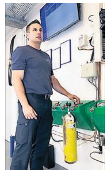
Am Feuerwehrstützpunkt am Erlenring werden auch die Atemluft-Flaschen der Atemschutzgeräteträger gereinigt, gewartet und befüllt.