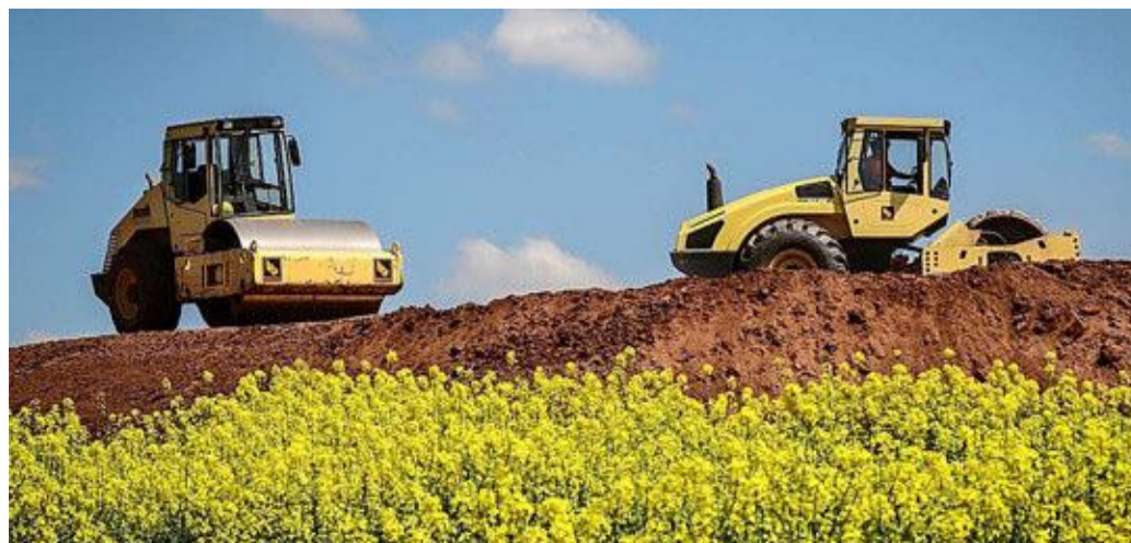
Die Arbeiten an der Ortsumgehung der B 252 dauern an.

Im Sommer 2013 wurde mit dem Bau des ersten Abschnittes der insgesamt 17,6 Kilometer langen Ortsumgehung von Münchhausen, Wetter und Lahntal begonnen. Dieser Bauabschnitt zwischen Wetter und Goßfelden bildet den mittleren Teil der künftigen Umgehungsstraße. Im ersten Abschnitt sind bereits Brücken, Unterführungen, Anschlüsse und Umbauarbeiten fertiggestellt worden. Im Oktober 2016 haben die Bauarbeiten im zweiten Bauabschnitt, der sich in eine nördliche und eine südliche Hälfte gliedert, begonnen.