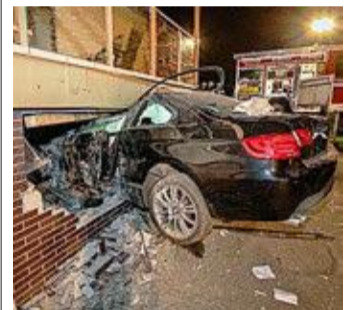
Am Montagabend kam es zu einem Unfall in Münchhausen.

Code scannen und das Video und Fotos dazu auf dem Handy ansehen