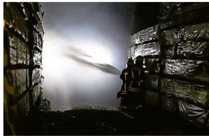
Mit vereinten Kräften dämmten die Wehrleute das Feuer ein.

Hinweise an die Kripo unter 0 64 21 / 40-60.