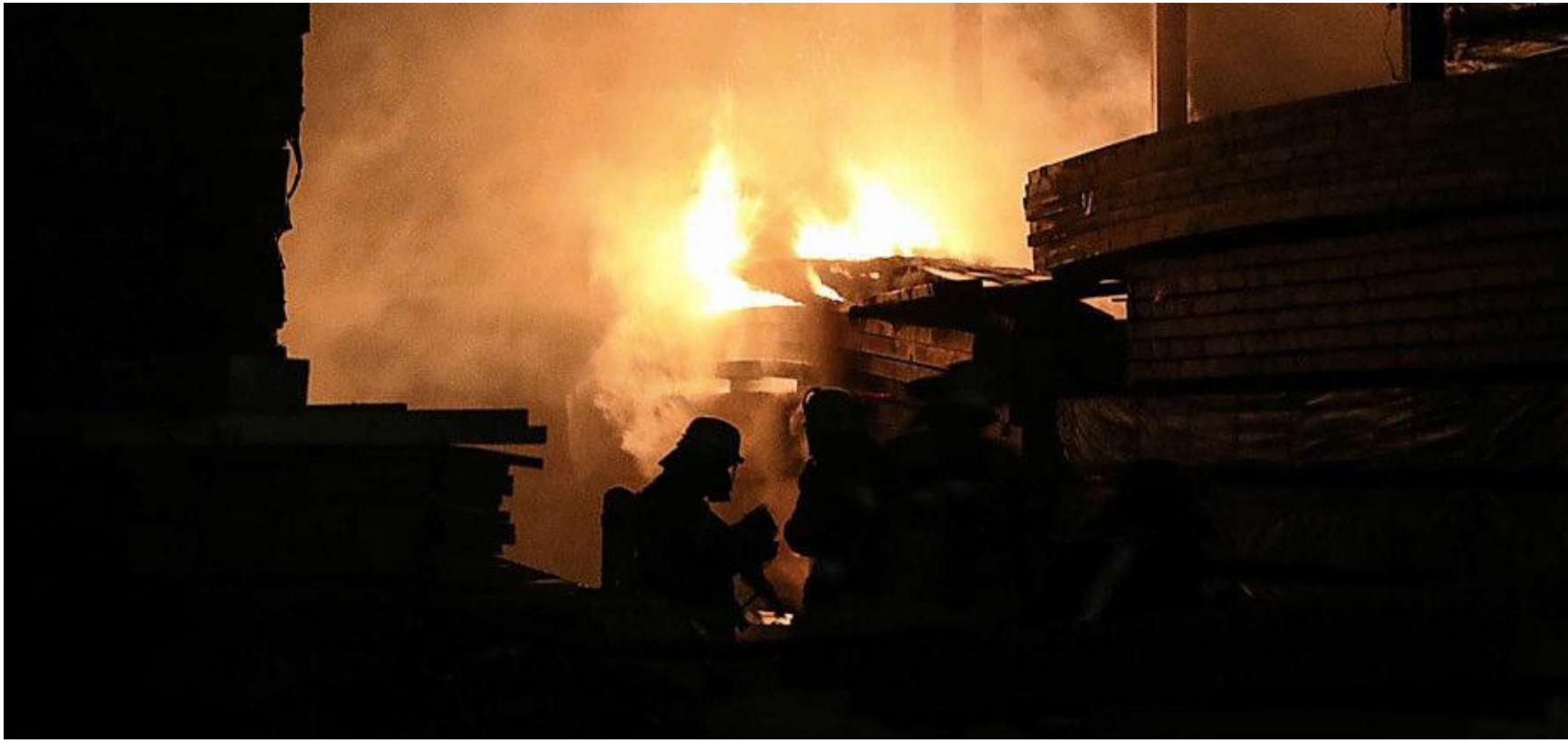
Die Wehrleute kämpfen im Sägewerk in Schönstadt mit den Flammen.