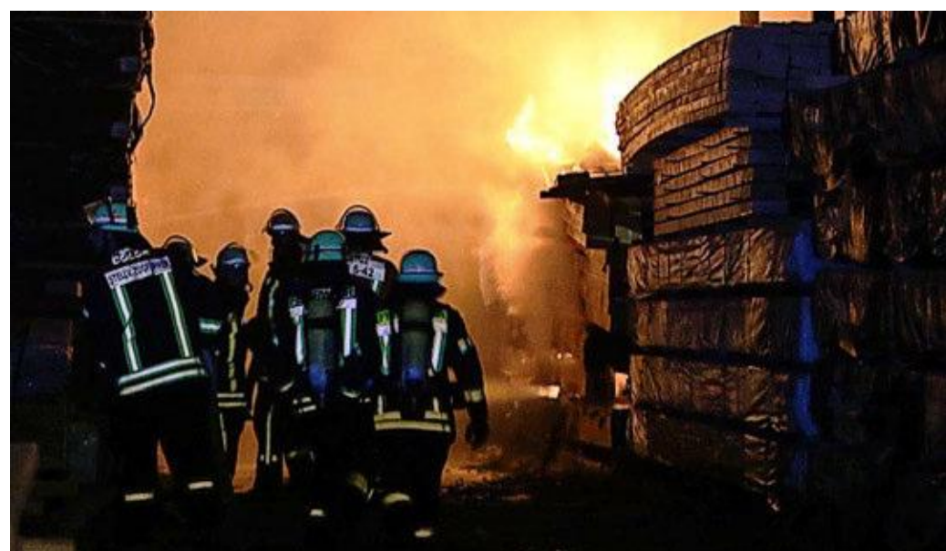
In der Nacht zu Dienstag kämpften 60 Feuerwehrleute aus Cölbe, Marburg und Kirchhain im Schönstädter Sägewerk gegen die Flammen.

Gestern untersuchte die Kriminalpolizei Marburg den Ort. Nach ersten Erkenntnissen gehen die Ermittler von Brandstiftung aus. Der Schaden beläuft sich nach Schätzungen der Polizei auf mindestens 10 000 Euro. Menschen sind durch das Feuer nicht zu Schaden gekommen. In dem Schönstädter Sägewerk lief der Betrieb gestern wie gewohnt weiter. Seite 11