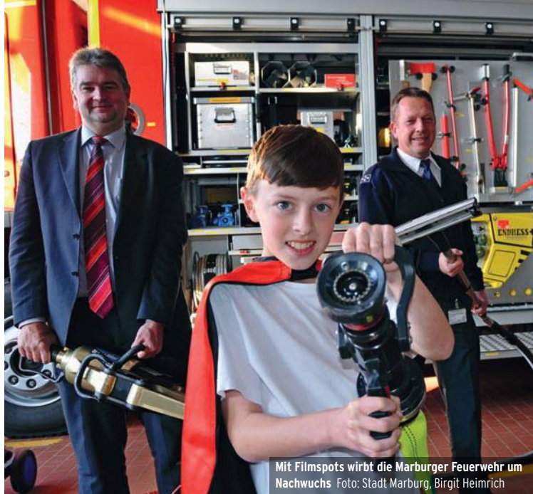
Mit Filmspots wirbt die Marburger Feuerwehr um Nachwuchs

Dann findet der Internationale Tag „Cities of Life“ statt. Es ist die weltweit größte Mobilisierung von Städten und Bürgern für Menschlichkeit und Achtung der Menschenrechte.