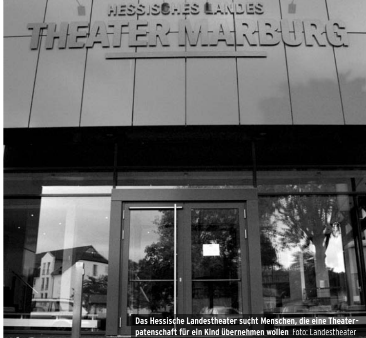
Das Hessische Landestheater sucht Menschen, die eine Theaterpatenschaft für ein Kind übernehmen wollen

http://www.med.uni-marburg.de/d-einrichtungen/transfusionsmed/