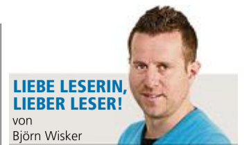
LIEBE LESERIN, LIEBER LESER! von Björn Wisker

Ein Video und mehr Fotos zu diesem Thema sehen Sie unter www.op-marburg.de