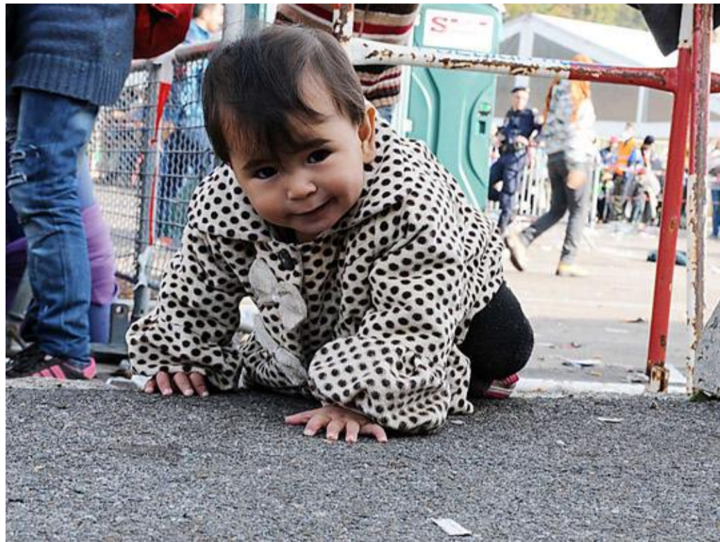
Die Zahl der Flüchtlinge sank in Deutschland zuletzt massiv, auch in Cappel leben seit Wochen weniger als 100 Asylbewerber. Ende Juni sollen 300 Neubewohner kommen. Archivfoto

Hintergrund des „Dies Academicus“ ist die Sorge der Philipps-Universität, dass „im aktuellen politischen Diskurs in Europa und in Deutschland mit beängstigender Geschwindigkeit das Verständnis für die Situation der Flüchtenden durch eine Sichtweise ersetzt worden ist, in der Flüchtende ebenso wie Migranten vorwiegend als eine Be-