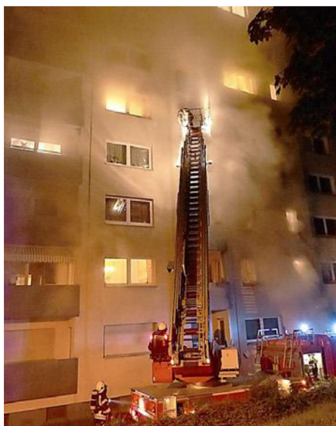
Im Keller des Wohnhauses Sudetenstraße 12 ist in der Nacht zum Montag ein Feuer ausgebrochen.

Zudem soll Auskunft darüber gegeben werden, wie viele Anwohner an welchem Standort als Dauermieter von Stellflächen registriert sind. „Vor dem Geldausgeben sollte eine Übersicht vorhanden sein, für wen wie viele Parkplätze in der Innenstadt zur Verfügung stehen“, heißt es in der Anfrage.