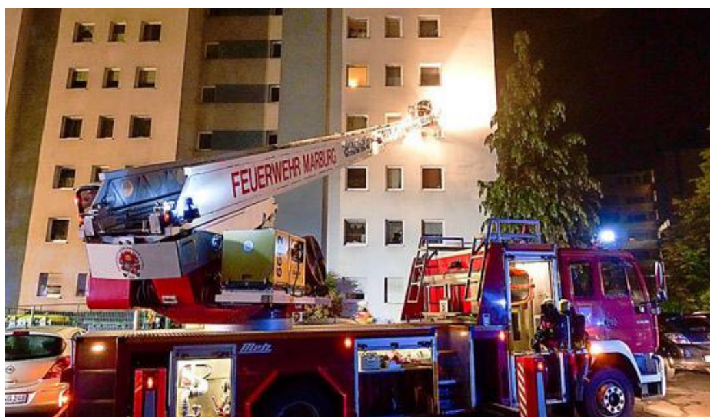
In der Nacht brannte es im Keller eines Hochhauses in der Marburger Sudetenstraße. Die Ursache für das Feuer ist noch unklar.

Marburg. Ein Hochhausbrand am Richtsberg hat drei Leichtverletzte gefordert. In der Nacht zu Montag brach aus noch ungeklärter Ursache ein Feuer im Keller des Gebäudes aus, woraufhin die Mehrheit der Bewohner aus dem Haus floh. Die freiwilligen Feuerwehren aus Marburg retteten weitere 24 über eine Drehleiter aus dem Hochhaus in der Sudetenstraße. Erschwert wurde die Rettungsaktion nach Feuerwehrrangaben dadurch, dass ein Auto die Rettungszufahrt blockierte, wodurch die Drehleiter kaum in Stellung gebracht werden konnte. Das verzögerte die Rettung der Hausbewohner – es ist nicht der erste Vorfall dieser Art, den die Brandbekämpfer beklagen. Seite 3