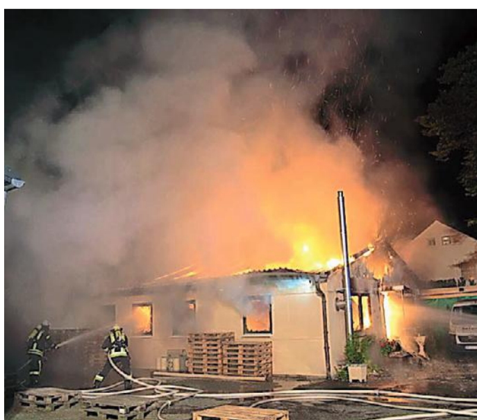
Feuerwehrlaute bekämpfen die Flammen, die aus dem Bürogebäude schlagen.

Sechsstelliger Schaden bei nächtlichem Brand in Rauschenberg