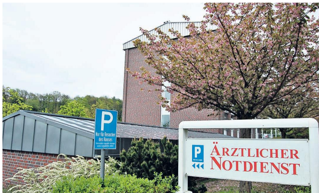
Notfall-Patienten müssen sich ab Juli an eine neue Adresse gewöhnen: Der Ärztliche Notdienst muss dem Kreisjobcenter weichen.

te sich die Linkspartei, die SPD stimmte nicht mit ab, weil sie die erst kurz vor der Sitzung eingegangenen Antworten des Kreisausschusses auf ihren Fra-