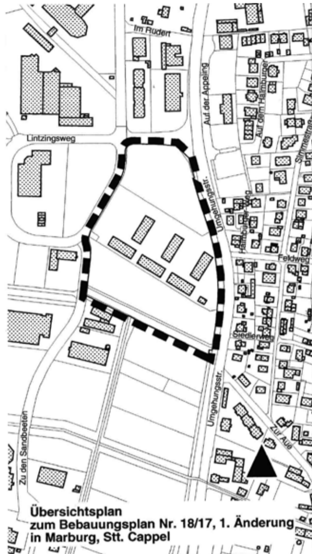
Übersichtsplan zum Bebauungsplan Nr. 18/17, 1. Änderung in Marburg, St. Cappel

Bauleitplanung der Universitätsstadt Marburg Bebauungsplan der Universitätsstadt Marburg Nr. 18/17, 1. Änderung „Feuerwahrstützpunkt und Jugendfeuerwehr- ausbildungszentrum“