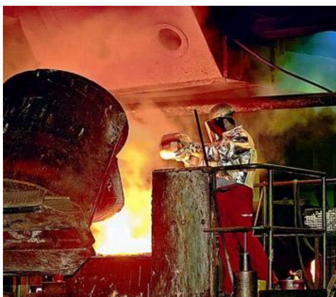
Der Betriebsrat der Eisengießerei Fritz Winter in Stadtallendorf ist hoffnungslos zerstritten.

Arbeitnehmer-Vertretung der Eisengießerei Winter ist zerstritten · Erster Rücktritt